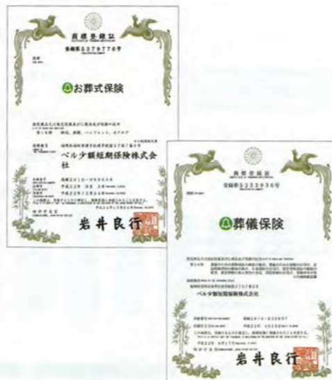
取得した「お葬式保険」(上)と「葬儀保険」(下)の商標登録

険料一定タイプ」、「保険金定額タイプ」、「シルバープラン」の3種のプランを揃え、全国に広がる代理店が1組、1組の家族と真摯に向き合い提供している。2月末時点で全国120社の代理店、4万5817人の会員を抱える同社。「地域に信頼される代理店づくり」を掲げる同社が目指すのは、顧客にとってわかりやすく、募集人にとっても勧めやすい保険。募集資料の見直しを進める一方で9月、12月にはそ